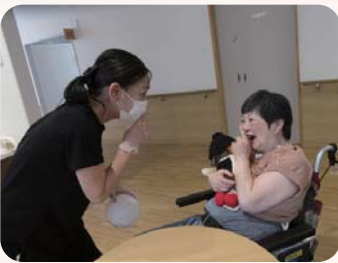
内緒話?? 今日も極上のショットが撮れました♡