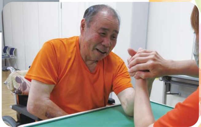
両手でズルしてますが…負けました。(笑)