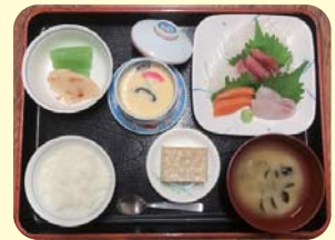
栄養士 福井 彩