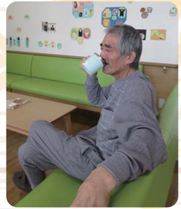
コーヒーを飲んでくつろいでいます