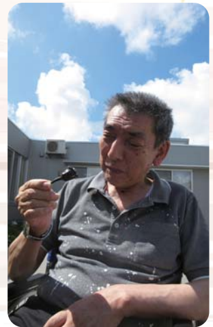
職員が折ってしまったナスのヘタを眺めているところ「あーあ(笑)」