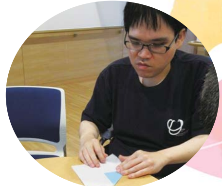
折り紙や切り絵で施設を華やかにしてくださる利用者さんの作品です！