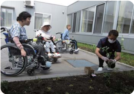
園芸部員の看護師はトマトとオクラを植えました！！ ※オクラは気が付いたら鳥に攻撃され、跡形もなく…(泣)