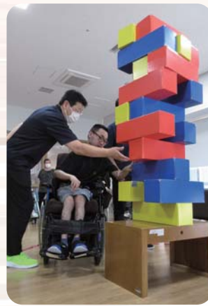
恒例★ジャンボジェンガ 狙いを定めて、慎重に…