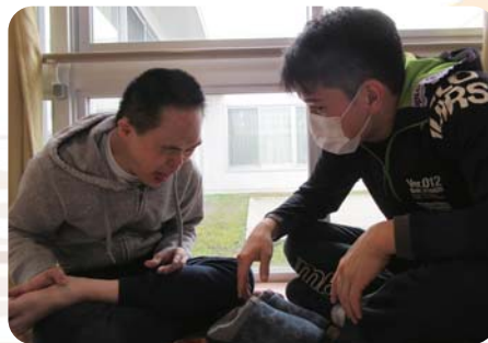
日向ぼっこをしている利用者さん 職員も同じように胡坐をかき、なにやら男同士の会話