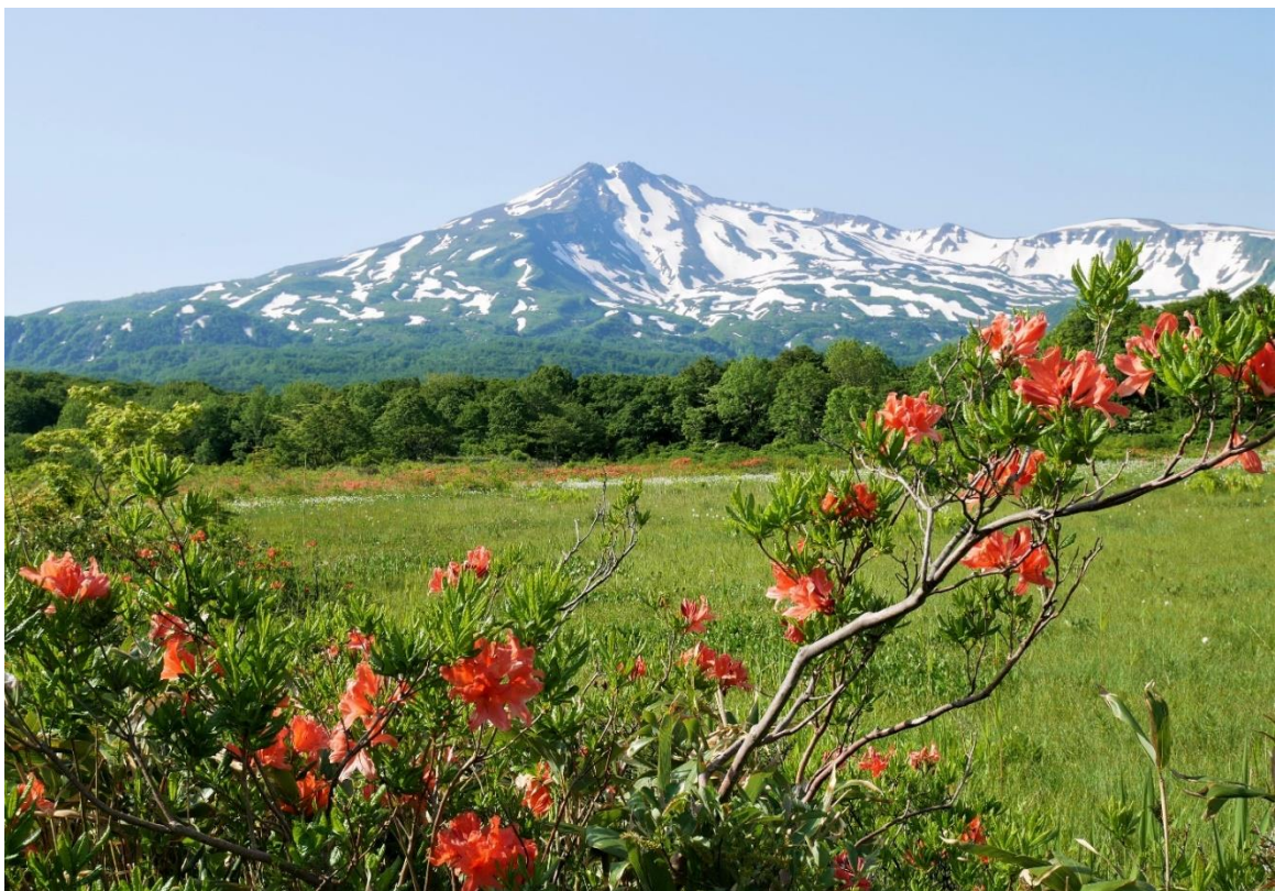
東北の名峰「鳥海山と桑の木湿原」