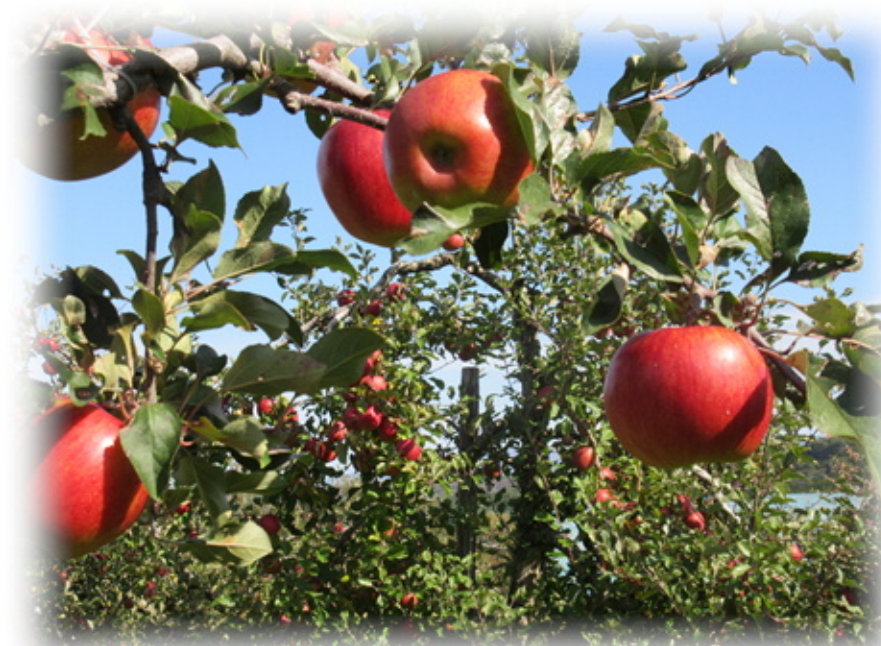
コロニー内果樹園